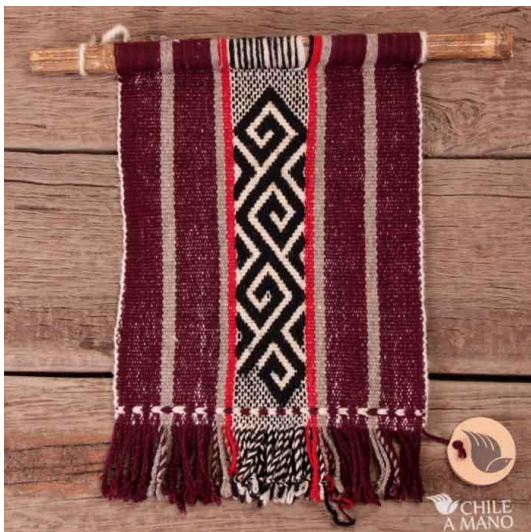
Mural a telar Mapuches