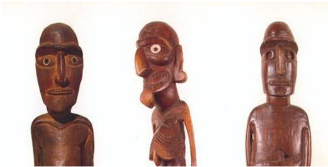
Tallados de madera Rapa Nui

Como sabemos y hemos aprendido en Historia, existen y existieron variados pueblos originarios, los cuales tenían sus propias manifestaciones artísticas. Por ejemplo: